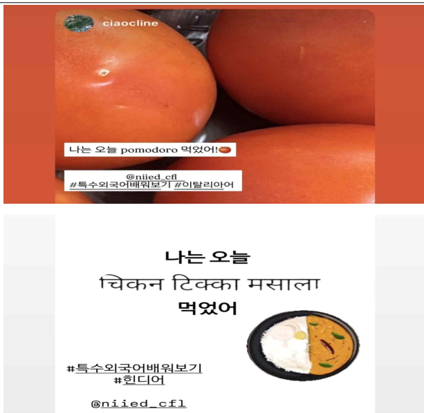
추가 미션 게시물