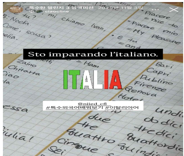
추가 미션 게시물